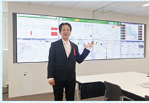
千葉市総合情報防災システム

6月に供用開始となる新庁舎は、「総合防災拠点」となります。暴風雨・地震等、自然災害の情報発信を市民の皆様いち早く発信、最先端の総合防災情報システムを有する危機管理センターが設置、市民の安心安全に向け、災害対応力が強化されました。