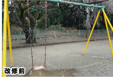
若松小学校のブランコ

老朽化により、子どもたちがケガをしないよう、管理更新を教育委員会主導で行うことを要望、各学校を調査し、危険遊具を指摘し、速やかに修繕・更新していただきました。